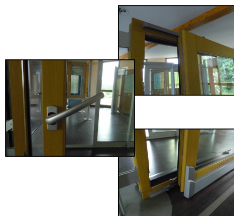
Poignée à 120°: ouverture du bas de l'ouvrant et coulissage de l'ensemble.