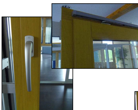
Poignée verticale: ouvrant en position fermé.

Poignée à 90°: ouverture du haut de l'ouvrant type oscillo-battant.